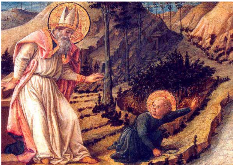
Филиппо Липпи «Видение блаженного Августина», ок. 1460