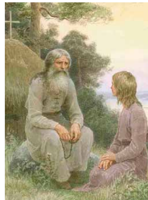
Художник Ефешкин С.Н. «Древняя Русь. Старец и послушник»

— Вот и я говорю, — улыбнулся старец, — стоит ли отвечать человеку на вопрос, когда вижу, что к моему ответу не готов вопрошающий.