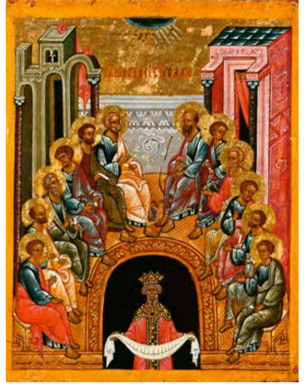
Сшествие Святого Духа на апостолов Конец XV — начало XVI вв. Новгород