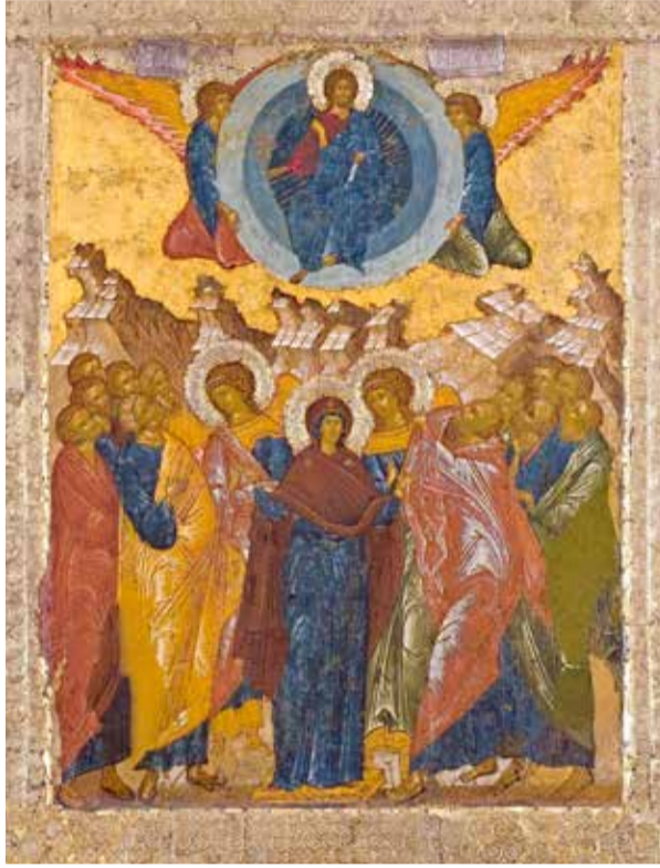
Вознесение Господне. Россия. XV в. Кирилло-Белозерский музей-заповедник