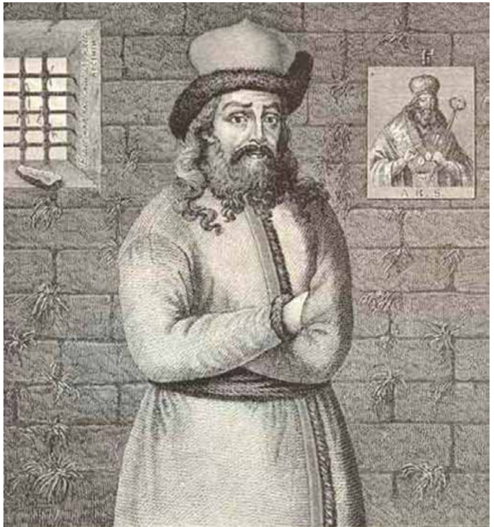
Всякъ образъ Крестный погнѣблющійъ грѣшество, и спасаемъ о Христѣ негатиъ благовоати естъ.