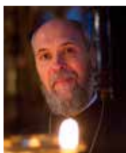
Протоиерей Олег ВРОНА, настоятель храма святителя Николая в Таллине, член Синода Эстонской Православной Церкви Московского Патриархата