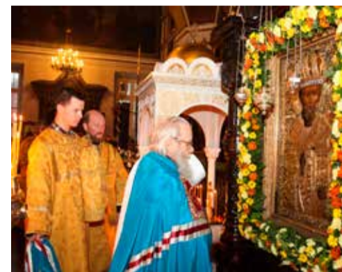
Престольный праздник в Никольском храме на ул. Вене

В 1990-е годы, когда Владыка Корнилий принял на себя бремя управления Эстонской Православной Церковью, она переживала непростые времена: отнималось церковное имущество, чрезвычайно трудно было выстраивать отношения с властями. Но в конце концов своей стойкостью он просто переменял отношение к Православной Церкви во всём государстве! У всего населения Эстонии Митрополит Корнилий снискал заслуженные почёт и уважение. С его словом стали считаться все. Это самый авторитетный епископ для всех жителей Эстонии. Соболез-