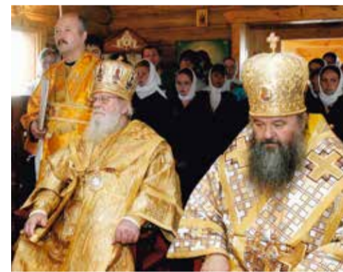
12.08.07. поселок Явас, Мордовия

Он имел очень большой авторитет. Ему в своё время предлагали возглавить список русских кандидатов в Рийгикогу – парламент Эстонской Республики. Он, конечно, набрал бы огромное количество голосов, но у него была принципиальная позиция: «Мы не вмешиваемся в политику». Постоянно какие-то политические силы пытались привлечь его на свою сторону, но он раз за разом отвечал: